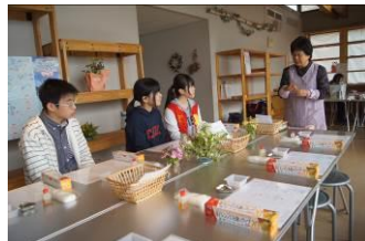
おのみち地区 ハーブ石鹸作り