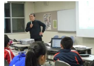
富山地区での体験学習