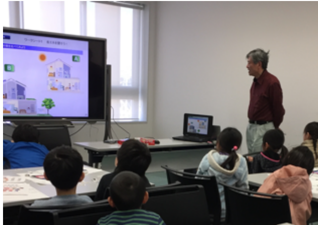
市民講師による放課後児童クラブでの出前教室(平成 29 年 3 月、富山県立山町北部小学校放課後児童クラブ)