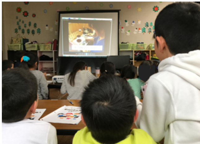
e 手仕事図鑑を活用した出前教室(平成 28 年 12 月、富山県立山町利田公民館)